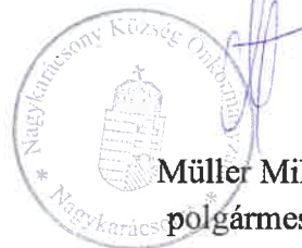
Müller Miklós polgármester